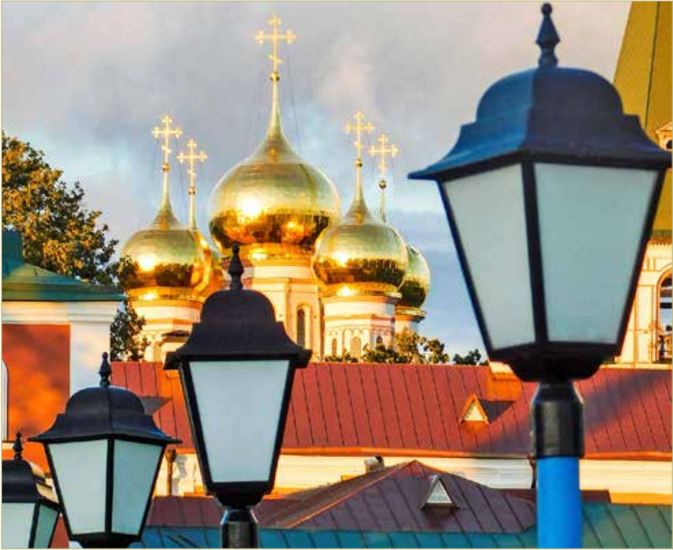
В паломнических поездках Тимур снимает православные храмы и мечтает сделать выставку этих фотографий.