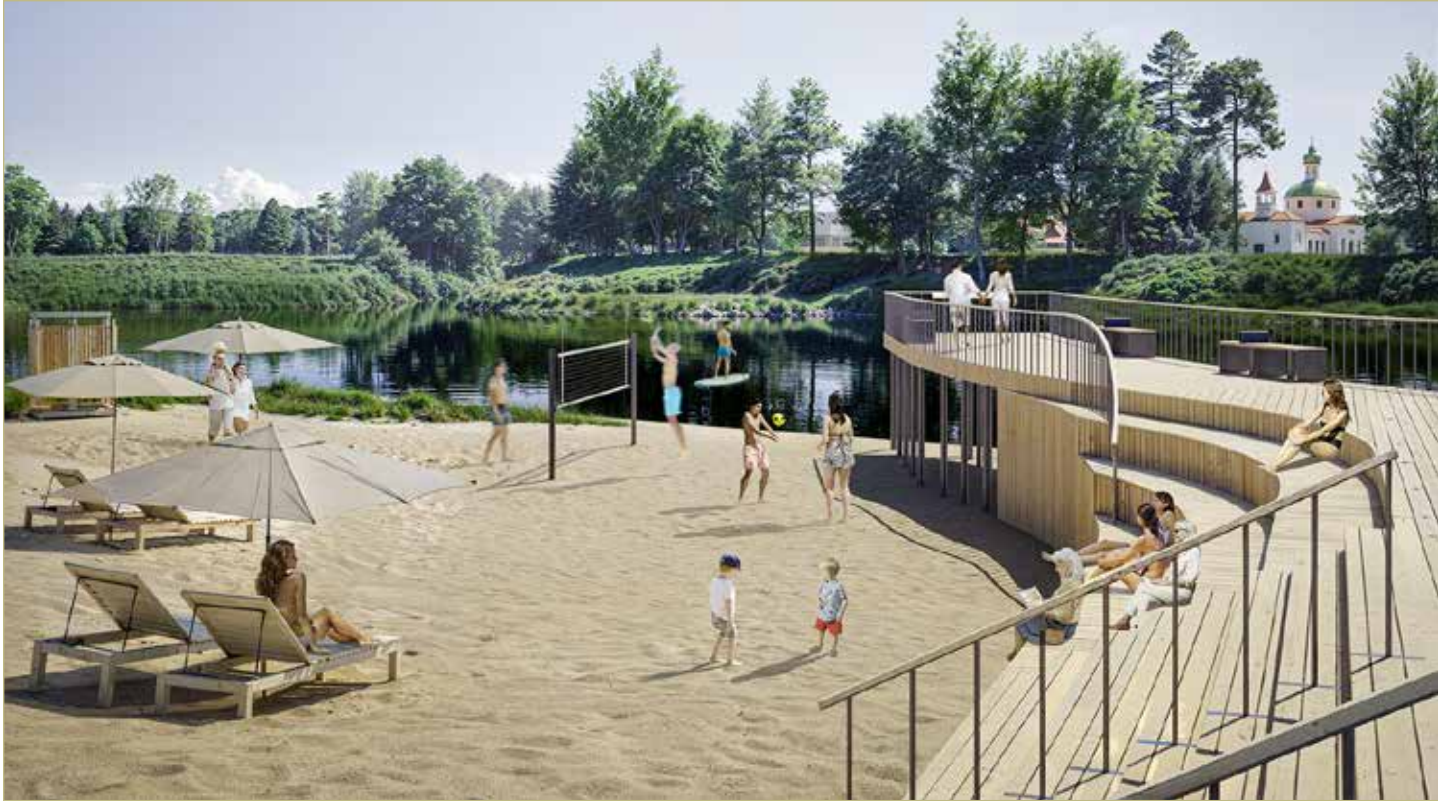
Концепция благоустройства территории берега Мологи в Пестове подготовлена компанией Parts Group.

Концепция предлагает все эти проблемы решить. Деревянный настил позволит создать пространство для