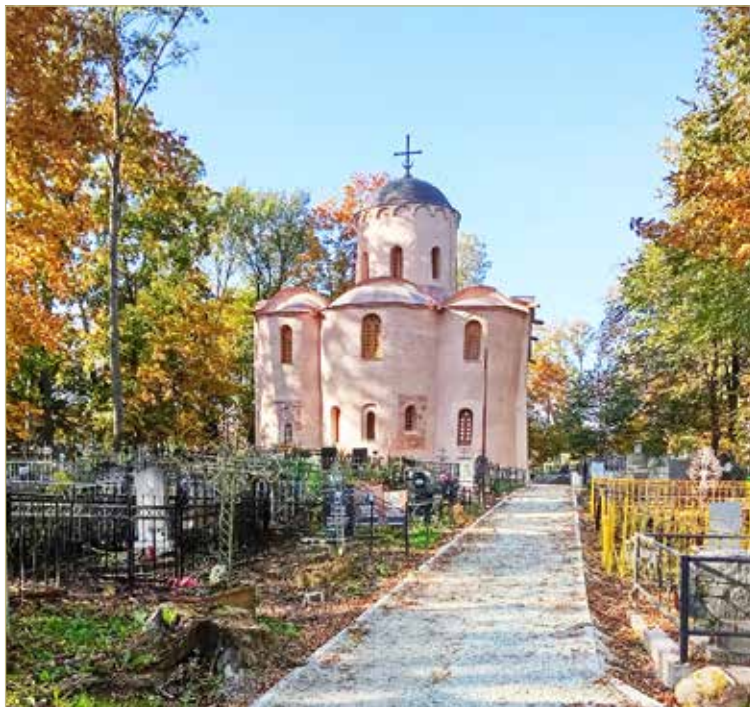
Церковь Святых апостолов Петра и Павла на Синичьей горе откроет свои двери в 2026 году.