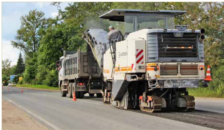
Ремонт дороги Бронница — Мшага. Всего до конца этого года в рамках нацпроекта «Инфраструктура для жизни» на территории Новгородской городской агломерации будет отремонтировано 13,5 км региональных дорог.

— В этом году наша задача — провести капитальный ремонт восьми железобетонных мостов. Среди самых крупных — мост через Мсту на автодороге Боровичи — Коегоща и мосты через Левочу и Кабожу на дороге Любытино — Хвойная. На них ремонты закончили. Всего сейчас в регионе работы идут на 13 мостах. Часть