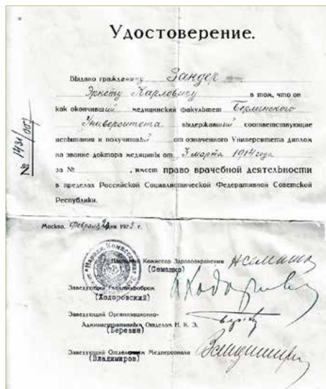
Работал доктор медицины с разрешения наркома здравоохранения.