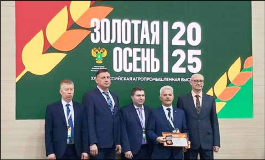
Проекты Новгородской области получили две золотых и одну бронзовую медали.