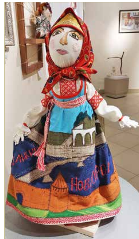
Кукла «Великий Новгород» — коллективная работа.

На выставке можно увидеть вышитые изображения Пушкина, Гоголя,